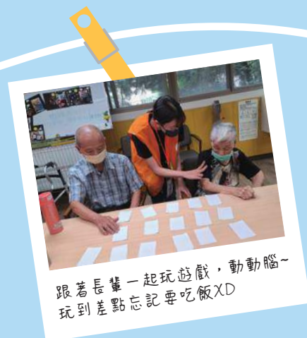
跟著長輩一起玩遊戲，動動腦~ 玩到差點忘記要吃飯XD