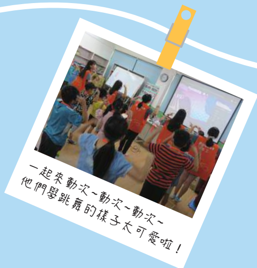
一起來動次~動次~動次~ 他們學跳舞的樣子太可愛啦!

從身心障礙者就學、就業等權益倡導，進而到發展遲緩兒童的早期療育服務、高齡長者的照護.....等，提供身、心、靈的全人社會福利服務，讓福音與福利得以實踐。